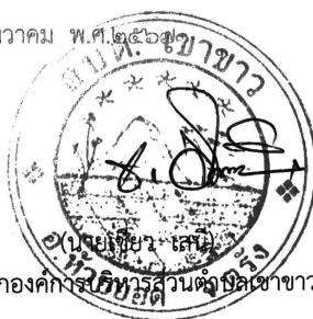
นายกองค์การบริหารส่วนตำบลเขาวัว