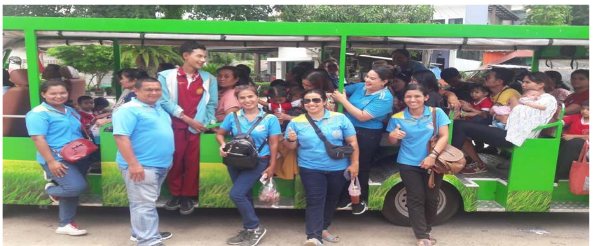
ภาพที่ ๑ เด็กนักเรียน ผู้ปกครอง และเจ้าหน้าที่เรียนรู้การทำนา และการทอผ้า ณ ตำบลนาหมื่นศรี อำเภอนาโยง จังหวัดตรัง ในกิจกรรมพัฒนาคุณภาพผู้เรียน กิจกรรมทัศนศึกษา