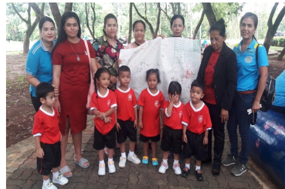
ภาพที่ ๔ เด็กนักเรียน และผู้ปกครอง ร่วมกันทำกิจกรรม “ครอบครัวสัมพันธ์” ณ สวนสาธารณะ สมเด็จพระศรีนครินทร์บรมราชชนนี ตรัง (เขาแปะช้อย) ในกิจกรรมพัฒนาคุณภาพผู้เรียน กิจกรรมทัศนศึกษา