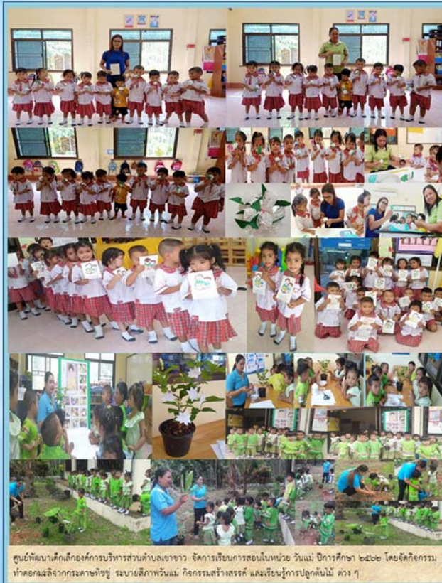
ศูนย์พัฒนาเด็กเล็กองค์การบริหารส่วนตำบลเขาขาว จัดการเรียนการสอนในหน่วย วันแม่ ปีการศึกษา ๒๕๖๒ โดยจัดกิจกรรม ทำดอกไม้จากกระดาษสีๆ ระบายสีภาพวันแม่ กิจกรรมสร้างสรรค์ และเรียนรู้การปลูกต้นไม้ ต่าง ๆ