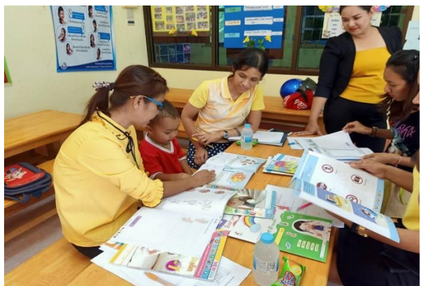
ภาพที่ ๒ ประชุมคณะกรรมการภาคี ๔ ฝ่าย เพื่อเห็นชอบหนังสือเรียนสำหรับเด็กปฐมวัย ของศูนย์พัฒนาเด็กเล็ก องค์การบริหารส่วนตำบลเขาขาว